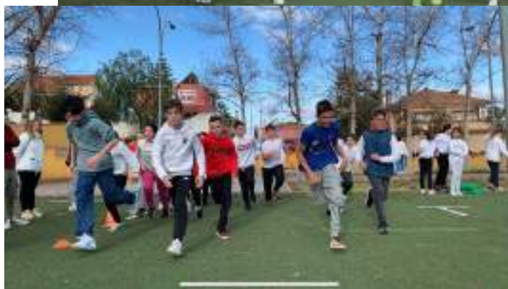
Alumnos del CEIP "Algazara" en plena competición deportiva