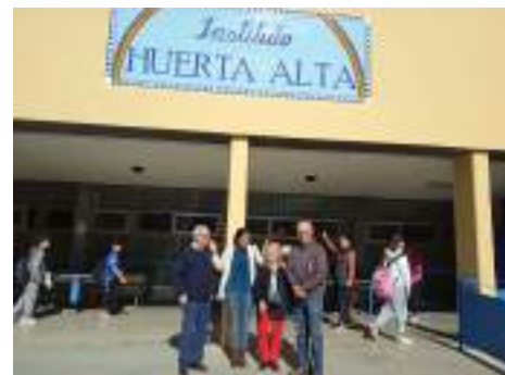
Charla en IES Huerta Alta