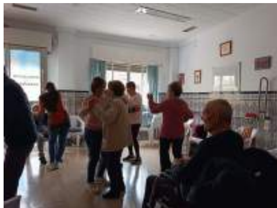
Grupo de asociados participan en el baile grupal.