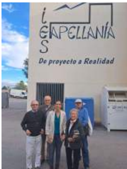
Charla en IES Capellanía