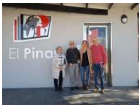
Charla en el Colegio El Pinar