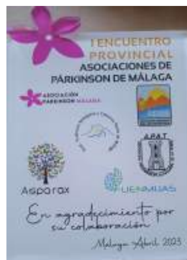
Placa conmemorativa para las asociaciones asistentes.